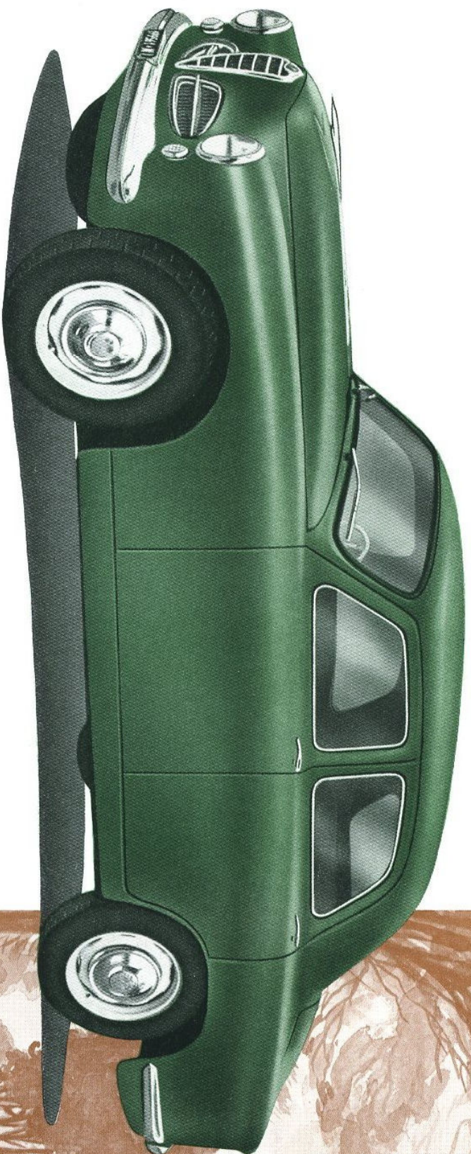
BERLINA T 1900

worden genoemd. Verreweg de meeste fabrikanten zouden een wagen als deze zeker niet hun 'standaardmodel' noemen, maar hem een zeer dure naam hebben gegeven.